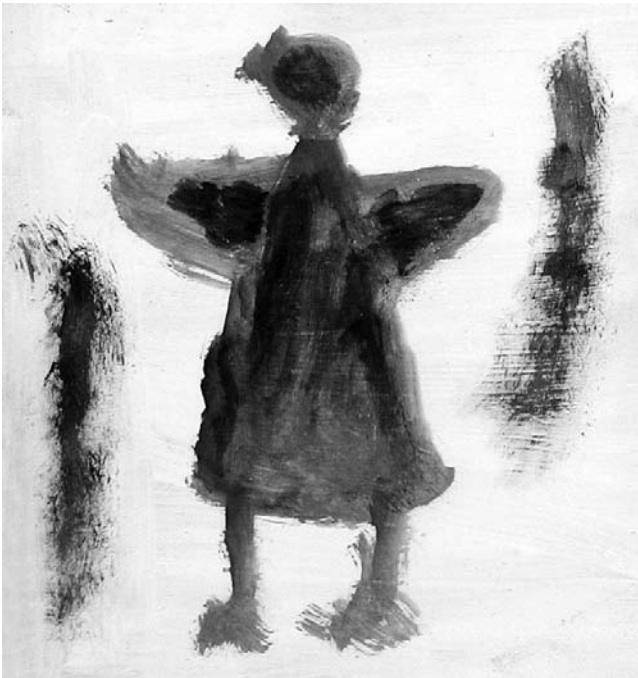
Dibujo: por Peter Villeger for the Disability Mural para el Mural de Discapacidades